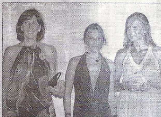
Eugenia Martínez de Irujo, espectacular, con un vestido largo.