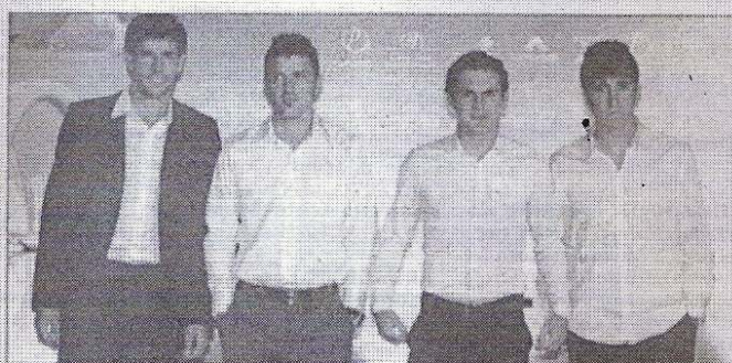
Los jugadores del Valencia Albelda, Villa, Mata y Pablo Hernández.