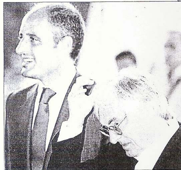
Francisco Camps y Bernie Ecclestone, anoche durante la gala.

Durante la cena — que consistió en ensalada de lubina, pitada rellena de foie e imperial de chocolate con mandarina —, fueron subastados objetos cedidos por pilotos y escuderías. Entre los enseres donados destacó dos sottomonos de Massa y Raikkonen y monos de trabajo de Heidfeld, Kubica, Alonso y Trulli.