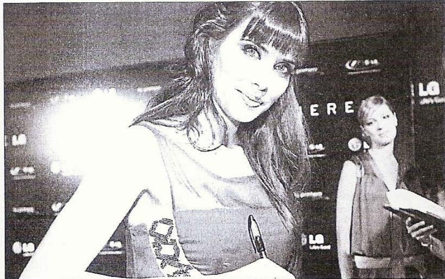
La presentadora Pilar Rubio derrochó simpatía durante la fiesta. MARGA FERRER

Su compañera en la serie televisiva de «El Internado», Marta Torné, deslumbró con un vestido de Cavalli en color champagne que resaltaba sus curvas y que lució sobre unos imponentes tacones. Entre los asistentes también se pudo ver al presentador Gon-