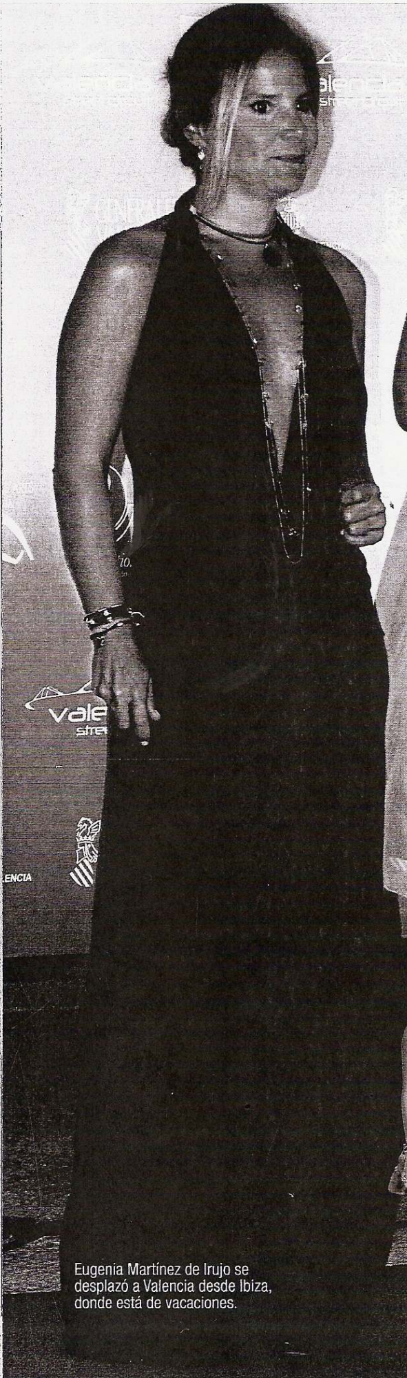
Eugenia Martínez de Irujo se desplazó a Valencia desde Ibiza, donde está de vacaciones.

Pero en ningún momento se dejaron ver juntos, pese a que ambos presenciaron la carrera y fueron los protagonistas de dos de las fiestas previas al