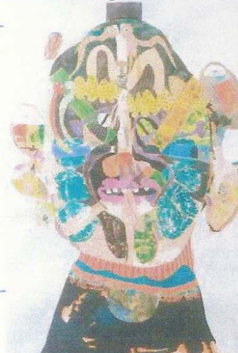
Zulu voodoo guru

● Zulu Voodoo Buddha Guru. Del 17 de septiembre hasta el 31 de octubre en Iguapop Gallery (Comerc, 15). Barcelona. iguapop.net